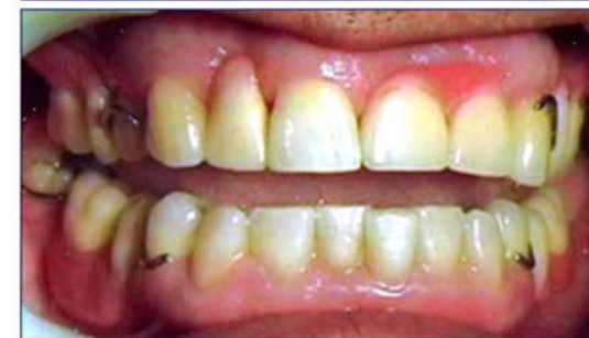
Differenze tra Deflex (con rest occlusali portanti) e la vecchia protesi con ganci metallici.