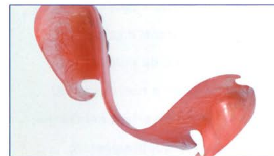
Nessun'altra così sottile, brillante e traslucida.